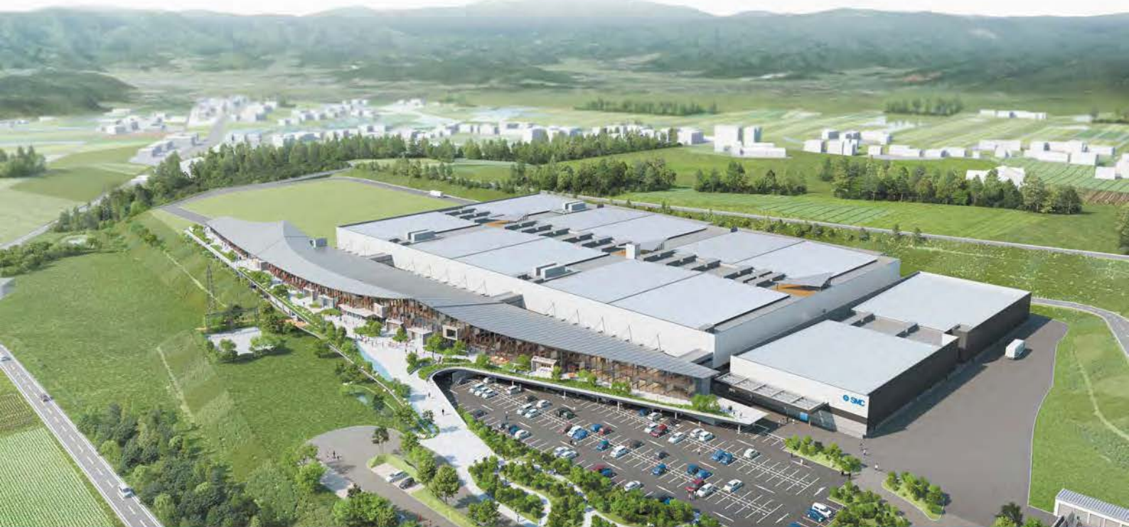
▲ 2025年8月稼働予定 SMC 遠野サプライヤーパーク

方向制御機器 / 駆動機器 / 空気圧補助機器など自動制御機器 熱交換機器 / 電動機器及びセンサー類 新分野における製品の製造販売