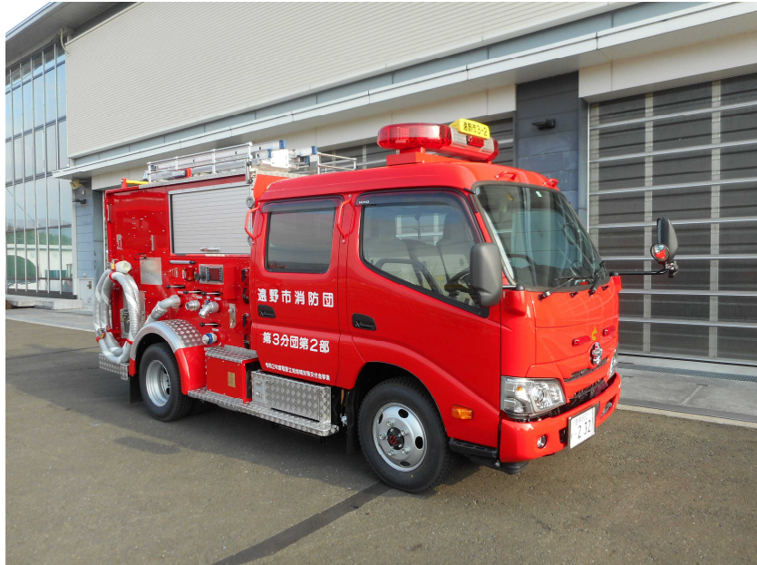
令和2年度遠野市消防団配備車両