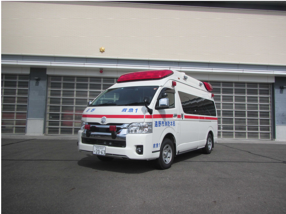
令和3年度遠野市消防本部配備車両